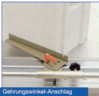
Gehrungswinkel-Anschlag Mitre square stop for bevel cuts