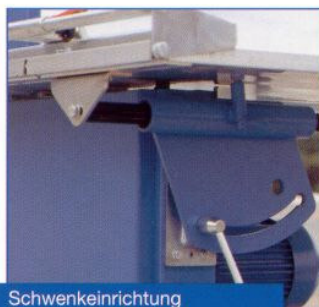
Schwenkeinrichtung Swivelling device