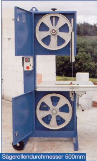
Sägerollendurchmesser 500mm Saw wheel diameter 500mm